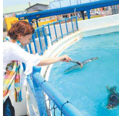
#アザラシのエサやり