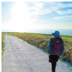
#海へつづく白い道