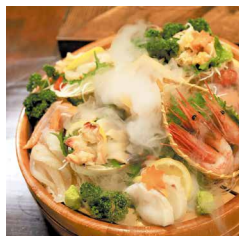
#刺身おけ盛り#玉手箱