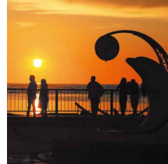
#ノシャップ岬の夕日