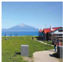
＃北のカナリアパーク