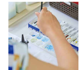
＃穴あき貝アクセサリー作り