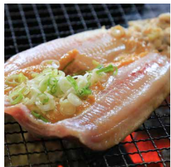
＃ほっけのちゃんちゃん焼き