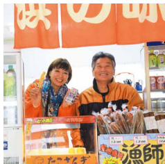
＃地元のお父さんとバチャリ！